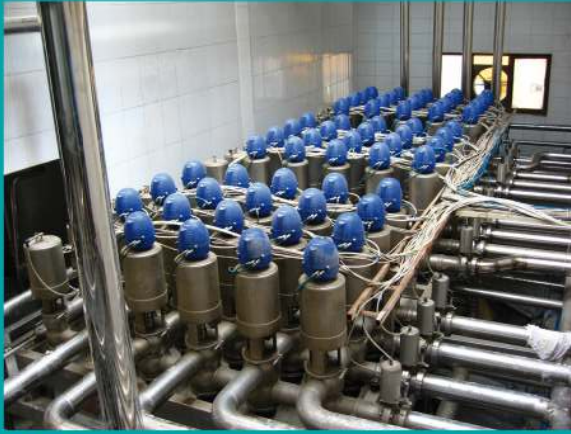
Mix Prove Valves