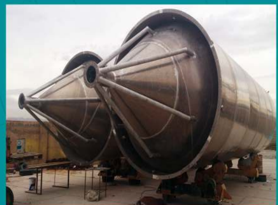
Aluminium Silo Tanks